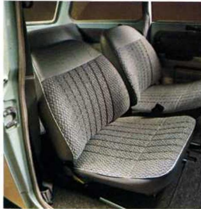
Trabant Limousine de Luxe

Mit «Hycomat» versehene Trabantwagen haben eine automatische Kupplungsvorrichtung. Sie sind also nicht nur für Schwerbeschädigte bestimmt, sondern erleichtern allen anderen Autofahrern das Fahren. Durch Fortfall des Kupplungspedals sind sie besonders für Linksamputierte geeignet, jedoch können auch Rechtsamputierte mit dem linken Bein Gas- und Bremspedal bedienen. – Die Auslieferung für mit «Hycomat» versehene Trabantwagen kann sich bis zu vier Wochen verzögern.