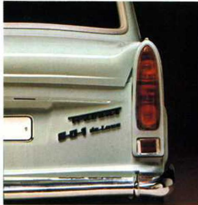
Trabant Limousine de Luxe