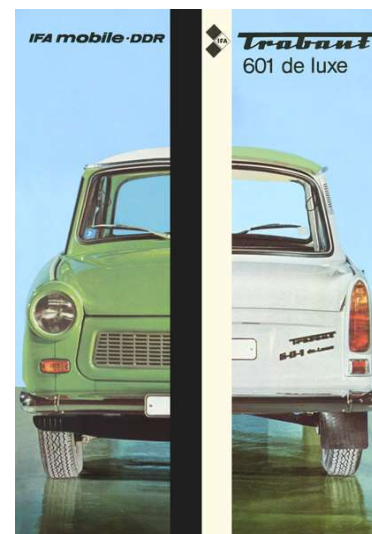
Limousine Luxus Trabant 601 de luxe Zum Prospekt ... »