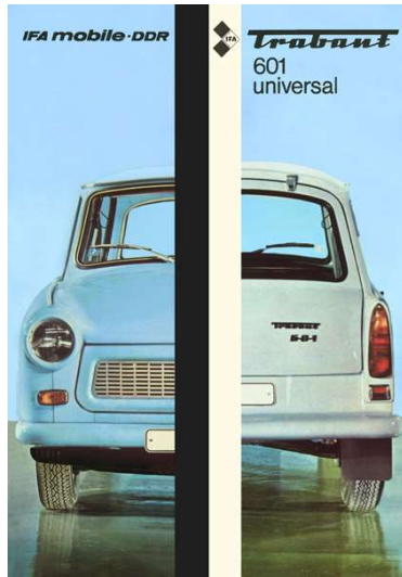
Kombiwagen Standard Trabant 601 Zum Prospekt ... »