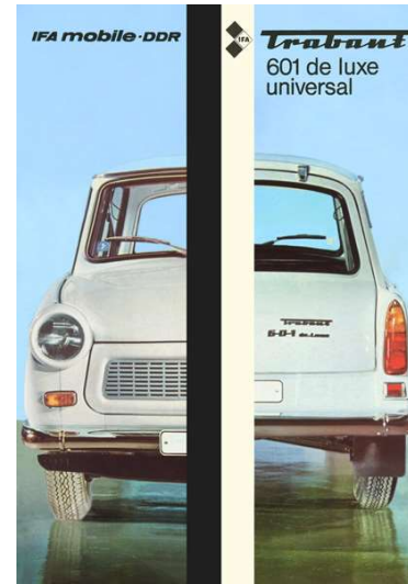
Kombiwagen Luxus Trabant 601 de luxe Zum Prospekt ... »