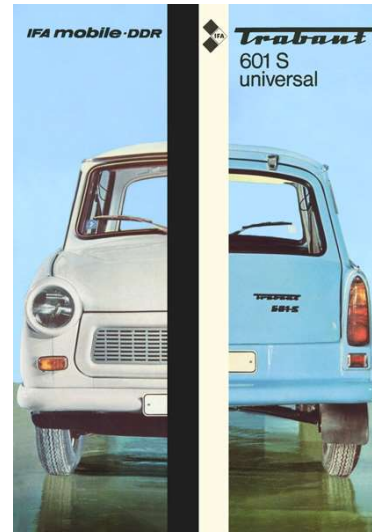
Kombiwagen Sonderw. Trabant 601 S Zum Prospekt ... »