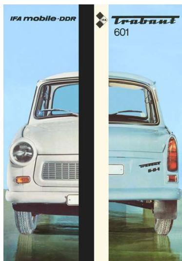
Limousine Standard Trabant 601 Zum Prospekt ... »