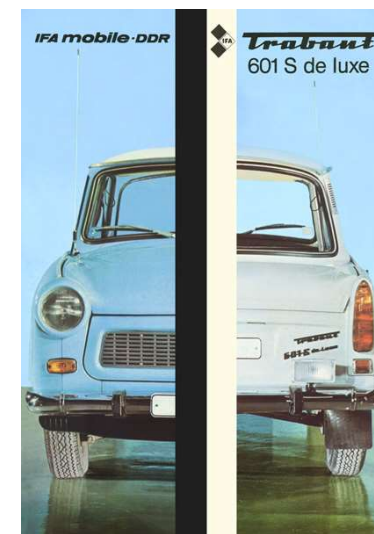
Limousine Luxus Trabant 601 S de luxe Zum Prospekt ... »