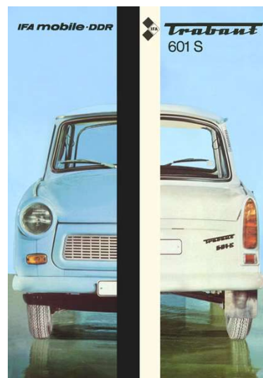
Limousine Sonderw. Trabant 601 S Zum Prospekt ... »